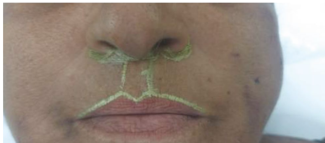
Figura 3 - Delimitação da área para excisão.

cando também a curva que toca o ponto médio da base columelar, bilateralmente (Figura 3).