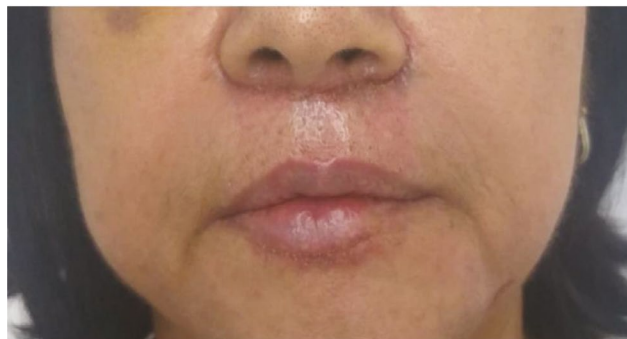
Figura 5 - Paciente 90 dias após a realização do procedimento.

A retirada do ponto foi realizada após 10 dias da realização dos procedimentos. Não foram identificadas intercorrências no caso estudado, como hematoma, necrose ou paralisia. Após 90 dias, foi observado uma melhora na estética facial. Ressalta-se a melhora da parte subnasal e do lábio superior, com a técnica de lip fitting, contribuindo para uma harmonia facial. Observou-se também a diminuição no distanciamento da base nasal com a linha de transição cutaneomucosa do lábio superior trazendo maior exibição do vermelhão do lábio superior (Figura 5).